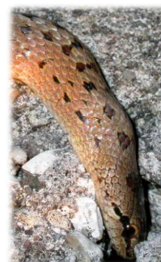
Coronella austriaca biscia ormai rara in pianura

Nel prato c'è qualcosa che il piccolo acrobata della città, il rondone, si meraviglia di trovare ancora tra le case, la pelle di un serpente che come un vestito troppo stretto è stata cambiata e lasciata a terra. E' chiara e leggerissima e possiede i rilievi delle squame del proprietario. Il serpente, forse una biscia d'acqua, un biacco, una coronella austriaca o qualche altra biscia non velenosa, non vive bene in città ed in campagna dove viene ancora