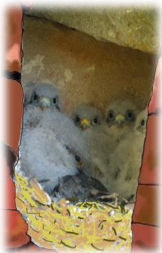
Piccoli di gheppio