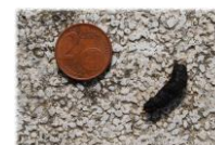
Bisognino di Rospo smeraldino

Un rumore delicato tra l'erba non lascia dubbi: un rospo smeraldino si sta avvicinando ad una lampada in un cortile per cercare insetti da