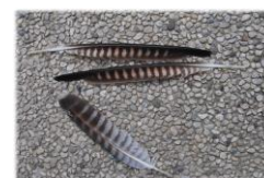
Penne di Falco pellegrino

Sopra la cupola della Cattedrale del Santo il Rondone Gedeone vede ora una penna dell'ala di un Falco pellegrino : che nobile visitatore per una Chiesa tanto importante! Gedeone accelera il battito delle sue ali: << Mi bastano le penne affilate dell'ala del Falco pellegrino per capire come questo animale possa lanciarsi in picchiata a tutta velocità inseguendo le prede, meglio allora che mi sposti di qui, non vorrei rischiare di fargli da pasto!>>