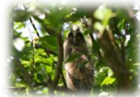
Piccolo di gufo

Ed eccolo lì sul pino il gufo che dorme! Si vede a fatica perché con il suo colore si confonde con la corteccia marrone: è infatti un animale mimetico che di giorno dorme e di notte si muove>>.